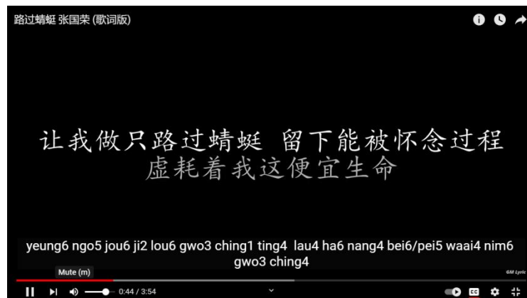
Gambar 4. Lirik lagu 路过蜻蜓

Dari lirik tersebut, capung disini didefinisikan sebagai sifat seseorang yang mengikhhlaskan orang yang dicintainya pergi. Penulis lagu mengibaratkan dirinya sebagai capung yang hanya lewat dan meninggalkan semua kenangan yang sudah dilalui bersama.