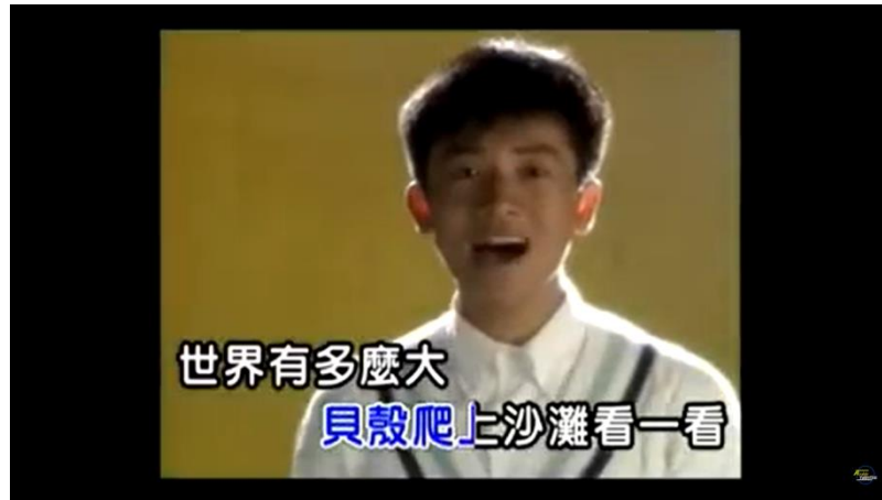
Gambar 13. Lirik lagu 蝴蝶飞呀

Di dalam lagu ini, terdapat tiga hewan yaitu kerang, ulat, dan kupu-kupu. 贝壳爬上沙滩看一看世界有多么大. Kerang memanjat pasir untuk melihat seberapa besar dunia ini. Kerang susah untuk berjalan ke pasir. Kerang diibaratkan adalah saya. Saya ingin melihat bahwa dunia seperti apa, maka dari itu saya harus berusaha sekuat mungkin agar dunia dapat melihat saya menjadi orang sukses.