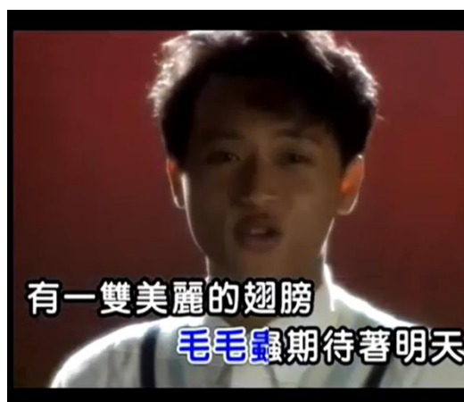
Gambar 14. Lirik lagu 蝴蝶飞呀

Ulat berharap untuk memiliki sayap yang indah besok