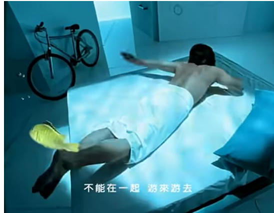
Gambar 8. Lirik lagu 我是一只鱼

Dalam bait tersebut, tergambar bahwa sifat manusia yang membutuhkan sosok orang lain di hidupnya sebagai sesuatu yang sangat penting. Ikan sendiri menggambarkan sosok “saya”, dan air menggambarkan sosok orang yang dibutuhkan. Dalam bait ini juga tergambar bahwa manusia membutuhkan sosok yang dapat menjadi teman hidupnya.