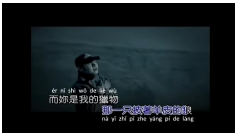
Gambar 9. Lirik lagu 披着羊皮的狼

Aku yakin akulah serigala berbulu domba itu