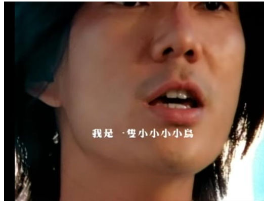
Gambar 2. Lirik lagu 我是一只小小鸟

Pada lirik tersebut, tergambar sosok burung kecil yang memiliki sifat manusia yang takut akan masa depannya. Ia merasa tidak sanggup terbang untuk menggapai mimpi yang terlalu tinggi. Ia juga merasa suatu hari nanti tidak ada sandaran untuknya dan akan menjadi sasaran pemburu.