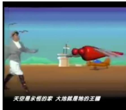
Gambar 1. Lirik lagu 红蜻蜓

Di dalam buku Simbolisme Hewan Cina , capung memperingati pemuda agung tapi canggung yang dibuang dari istana Kaisar. Capung juga disebut Lalat Taifun karena nampaknya serangga ini bergerombol dalam jumlah besar sebelum datangnya badai. Orang percaya ia dijadikan kuat oleh angin. Capung merah memiliki dua arti, satu melambangkan pemberantasan hama, yang lain melambangkan kegembiraan, keberuntungan, dan juga berarti "kemenangan".