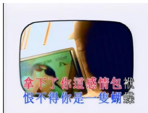
Gambar 6. Lirik lagu 蝴蝶

Saya berharap Anda adalah kupu-kupu, datang dan pergi dengan cepat