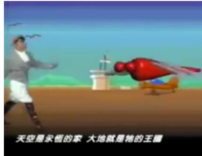
Gambar 3. Lirik lagu 红蜻蜓

Dalam bait tersebut, tergambar bahwa setiap manusia sejak masa kecil memiliki cita-cita atau impian yang ingin digapai. Akan tetapi, tidak dapat dipungkiri bahwa dalam mencapai impian tersebut terkadang ada angin atau badai yang dapat diartikan sebagai rintangan dan tantangan. Namun karena nampaknya capung selalu bergerombol dalam jumlah yang besar sebelum datangnya badai, hal itu dipercaya adalah sosok yang kuat karena angin dan badai. Jadi dapat dimaksudkan bahwa dalam bait ini capung merah memberi harapan dan kekuatan dalam mencapai impian dan kesuksesan suatu hari nanti.