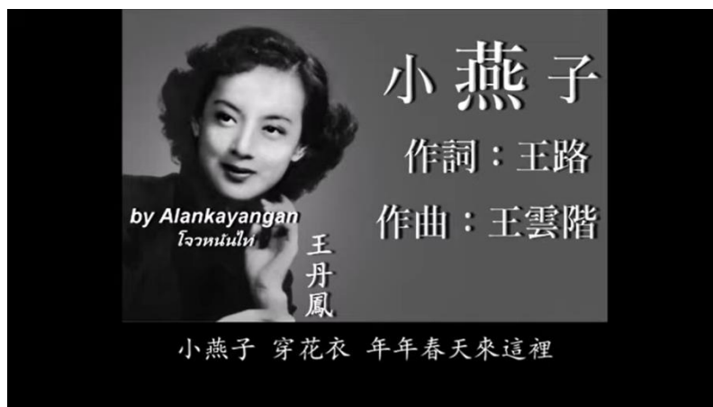
Gambar 7. Lirik lagu 小燕子

Walet kecil mengenakan gaun bermotif bunga Saya bertanya kepada walet mengapa Anda datang Walet berkata bahwa mata air di sini adalah yang paling indah