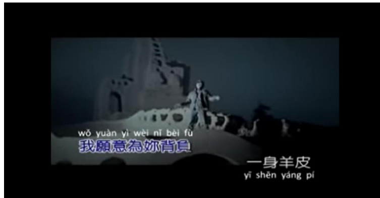
Gambar 10. Lirik lagu 披着羊皮的狼

Di dalam bait pertama, tergambar bahwa penulis lagu sangat mencintai seseorang sehingga ia pun rela mengubah dirinya menjadi kulit domba yang mengarah dengan sifat kelembutan manusia. Ia berharap bahwa seseorang yang ia cintai tidak memberi salju. Salju disini merujuk pada sifat dingin atau cuek seorang manusia.