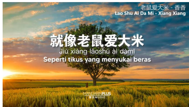
Gambar 11. Lirik lagu 老鼠爱大米

Pada lirik我爱你爱着你 memiliki arti saya benar-benar mencintai kamu, 就像老鼠爱大米 yang berarti seperti tikus menyukai beras. Sehingga lagu ini memberi arti bahwa seseorang yang sayang dengan pasangannya seperti tikus yang menyukai beras. Jadi kesimpulannya adalah lagu ini menunjukkan tentang kesungguhan cinta seseorang.