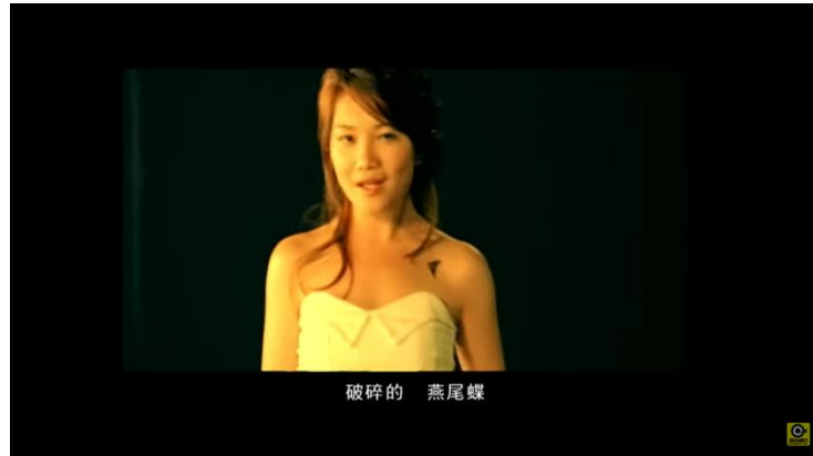
Gambar 12. Lirik lagu 燕尾蝶

Pada lirik lagu tersebut, menggunakan kata kupu kupu swallowtail. Penggunaan hewan tersebut menggambarkan tentang seseorang yang ingin mencapai kesuksesan akan tetapi terhalang oleh rintangan. Hal ini dapat dibuktikan bahwa pada lirik pertama sebagai 你是火 你是风 你是织网的恶魔 Kamu adalah api, kamu adalah angin, kamu adalah iblis yang menjerat. Dan pada lirik kedua yaitu 破碎的 燕尾蝶 还做最后的美 Aku adalah kupu-kupu walet yang masih memimpikan mimpi indah. Dan pada lirik berikutnya yaitu 你是火 你是风 你是天使的诱惑 Kamu adalah api, kamu adalah angin, kamu adalah godaan para malaikat. Dan lirik terakhir 让我做燕尾蝶 拥抱最后的美梦 Biarkan aku menjadi kupu-kupu walet, menggapai mimpi indah terakhirku. Pada keseluruhan lirik tersebut, lagu ini menceritakan tentang orang yang ingin mencapai kesuksesan akan tetapi terhalang oleh rintangan.