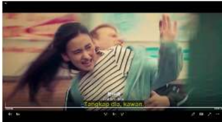
Gambar 4. Yonah diserang oleh para pembully