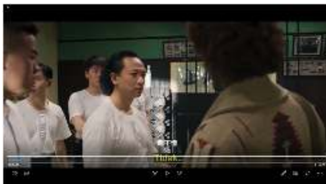
Gambar 9. Para murid tidak mengerti apa yang orang asing katakan

Bsu : 听不懂 Tīng bù dǒng (tidak bisa mengerti)