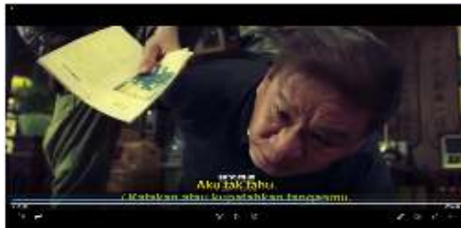
Gambar 2. Master Gwai Dipaksa Memberikan Informasi