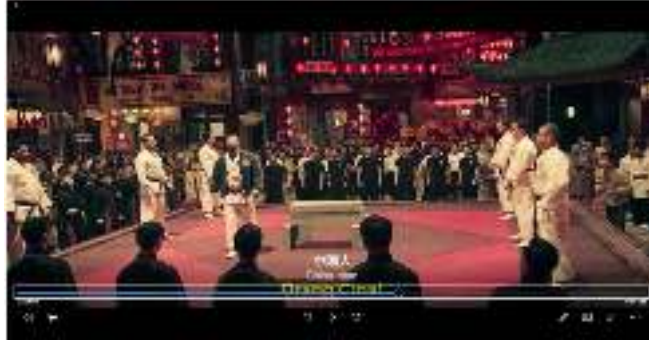
Gambar 18. Petarung karate sedang menantang para master