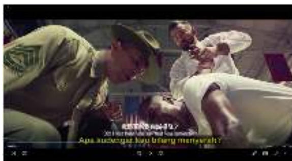
Gambar 6. Pelatih sedang Mengajari Salah Satu Kadet Berkelahi

Bsu : 我是否听到你喊投降 Wǒ shìfǒu tīng dào nǐ hǎn tóuxiáng