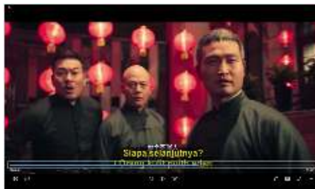
Gambar 17. Para Master kesal dengan orang kulit putih