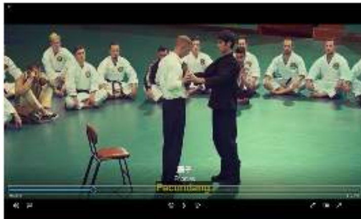
Gambar 7. Bruce Lee akan melakukan tendangan