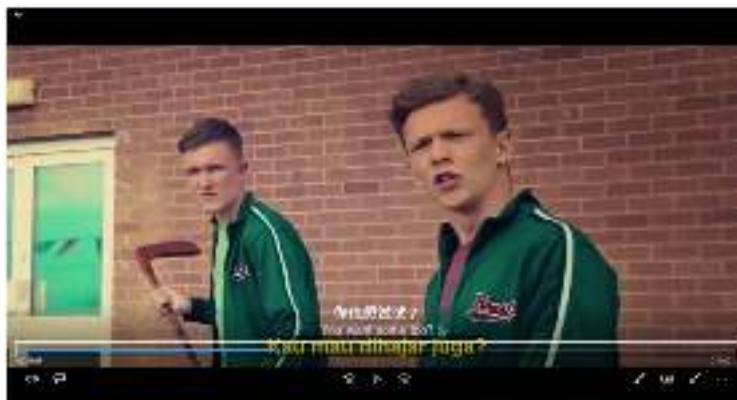
Gambar 8. Para pembully sedang melakukan aksi pembullyan