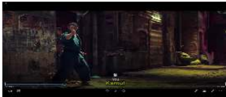
Gambar 1. Petarung Karate Menantang Musuhnya