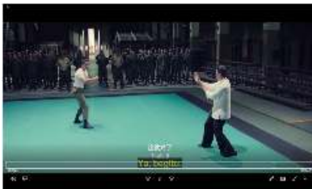
Gambar 14. Master Ip melawan Sersan Gunny

Bsu : 这就对了 Zhè jiù duìle (sekarang sudah benar)