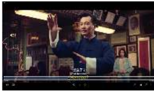
Gambar 12. Master Wan melawan Master Ip