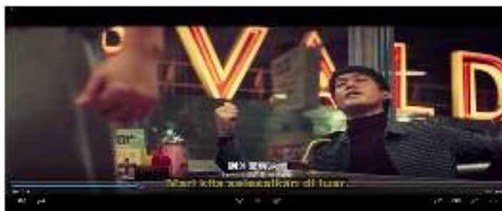
Gambar 3. Bruce Lee memerintahkan muridnya untuk menyelesaikan keributan di luar ruangan

Bsu : 到外面解决吧 Dào wàimiàn jiějué ba (mari selesaikan di luar)