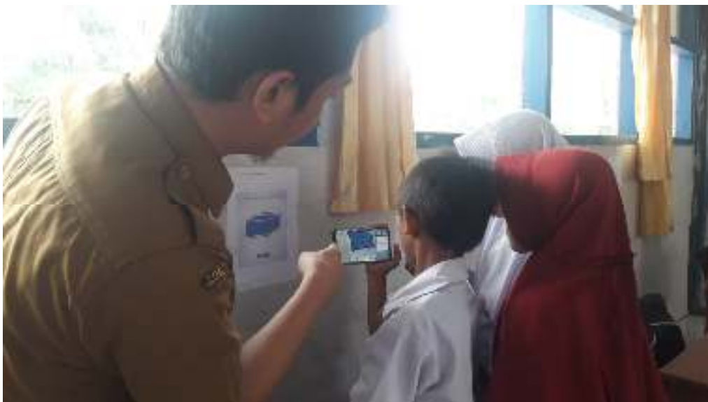
Gambar 2. Penggunaan Media AR Bangun Ruang