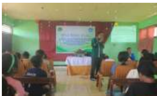
Gambar 2. Kegiatan pembinaan Iman Anak

Berdasarkan hasil penelusuran dokumentasi sekolah diperoleh kegiatan- kegiatan yang pernah diadakan dengan memanfaatkan lingkungan SDK Wolomeli :