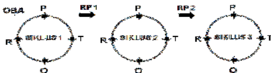
Gambar 1. Bagan Siklus Penelitian Tindakan Kelas

Keterangan : OBA: Observasi Awal, P: Perencanaan, T: Tindakan, O: Observasi, R: Refleksi, RP1: Revisi Perencanaan 1, RP2: Revisi Perencanaan 2.