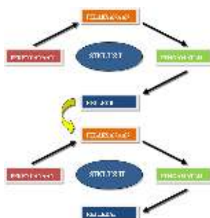
Gambar 1. Alur Pelaksanaan PTK Model Kemmis dan Taggart

Penelitian ini bertujuan untuk meningkatkan pengayaan kosakata pada pembelajaran Descriptive Text melalui penerapan Educandy . Penelitian ini merujuk pada model spiral Kemmis dan Mc. Taggart dimana terdapat 4 langkah yang meliputi Perencanaan (Planning), Tindakan (Acting), Pengamatan (Observing) dan Refleksi (Reflecting). Hal ini sesuai dengan pernyataan Kemmis dan Taggart (2010) membagi prosedur penelitian tindakan dalam empat tahap kegiatan pada satu putaran (siklus) yaitu: perencanaan – tindakan dan observasi – refleksi. Model penelitian tindakan tersebut sering diacu oleh para peneliti tindakan.